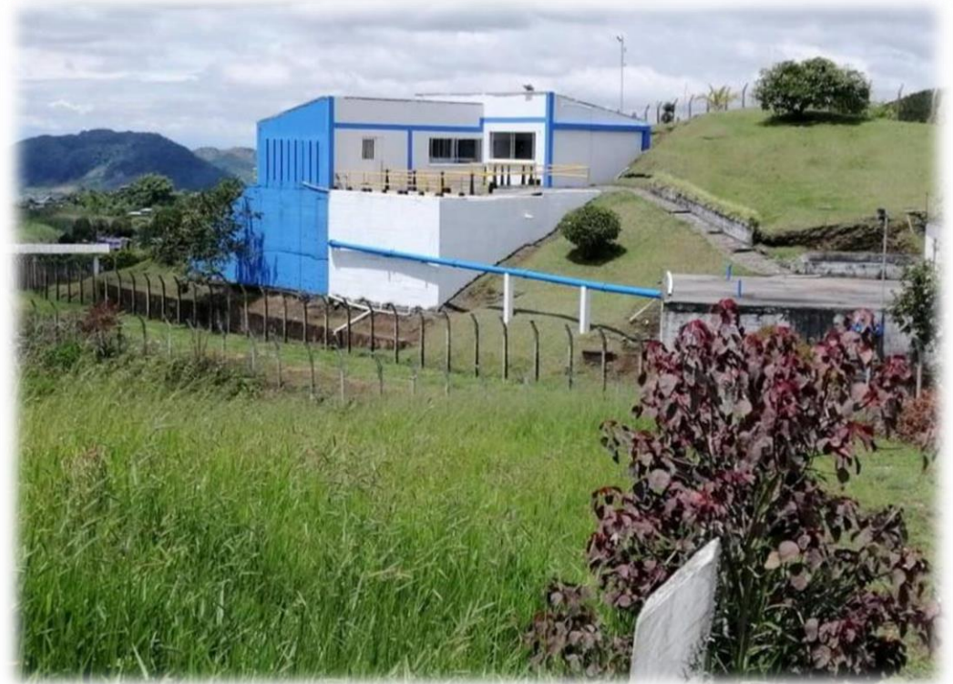
Planta de Tratamiento de Marquetalia

La Empresa de Obras Sanitarias de Caldas “EMPOCALDAS S.A E.S.P” es una Sociedad Anónima Comercial de Nacionalidad Colombiana, del orden Departamental, clasificada como empresa de servicios públicos, con autonomía administrativa, patrimonial y presupuestal, que se rige por lo dispuesto en la Ley 142 de 1994 y la Ley 689 de 2001.